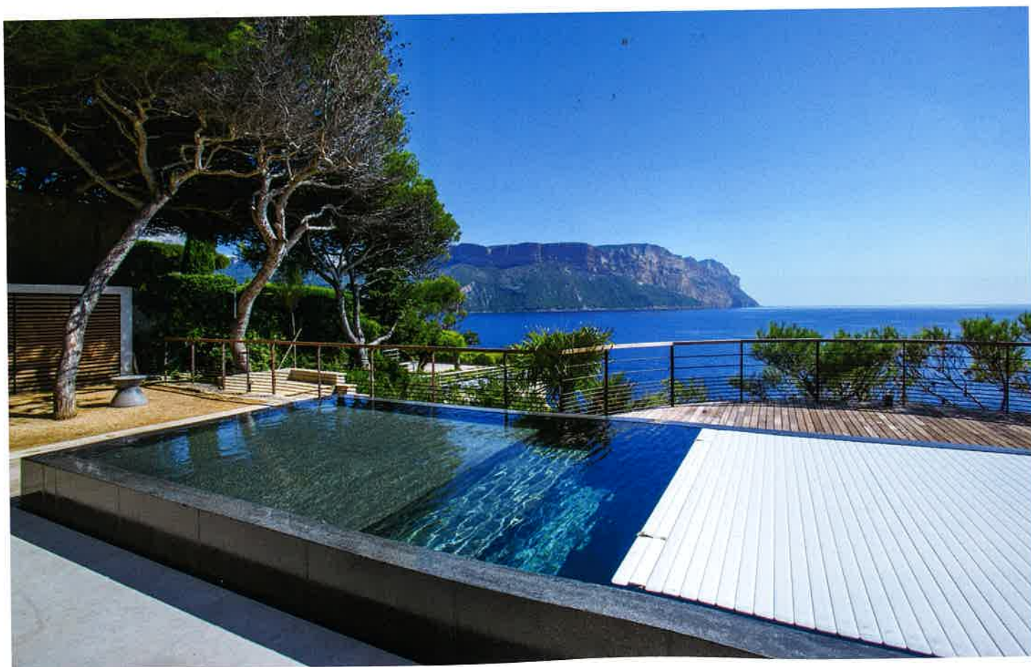
Réalisation : Aqua Diffusion Piscines - réseau Carré Bleu

Les caillebotis sont eux aussi proposés en PVC (dans une déclinaison de teintes claires), mais aussi en bois (composite ou massif : ipé ou robinier) ou en métal (inox et aluminium coloré). Certaines configurations permettent de laisser les caillebotis immergés : plus esthétique, cette solution est plutôt destinée aux installations en PVC.