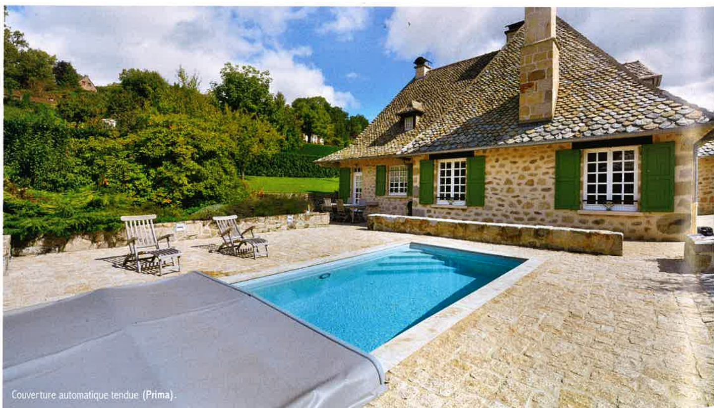
Couverture automatique tendue (Prima).

Plusieurs couvertures automatiques bénéficient d'un coffre de rangement semblable à celui d'un volet. Ce dispositif protège la couverture lorsqu'elle est repliée, tout en pouvant faire office de solarium. Il est fréquent de trouver des panneaux photovoltaïques sur ce coffre pour bénéficier d'une autonomie complète de fonctionnement.